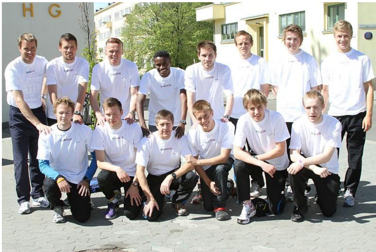
Lillehammers herrelag løp glimrende i Holmenkollstafetten.

Lillehammers damer var nærmere Vidar denne gangen