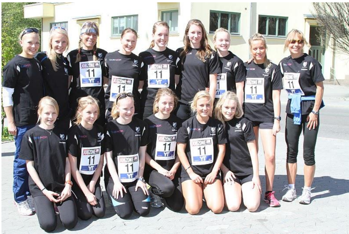
Damelaget ble nummer 9 i eliteklassen. Det var meget bra.