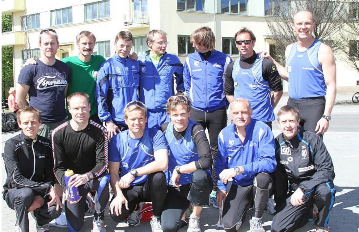
Veteranlaget løp inn til andreplass i år også.