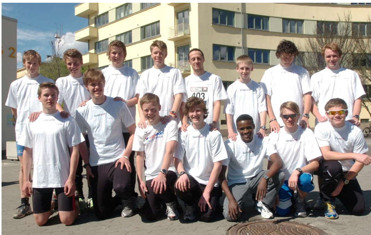
Juniorlaget løp inn til en sjetteplass i sin klasse.