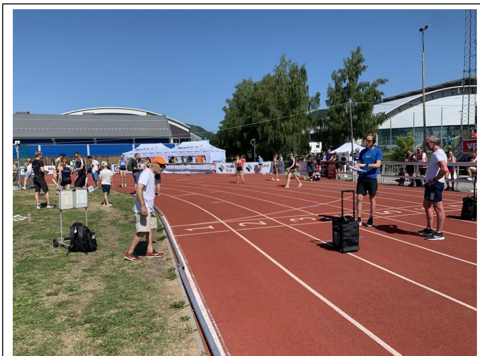
Fine forhold for friidrett i år, men vi kan vel ikke regne med at det blir slik i all fremtid.

En annen sak er også hvor vi bør holde til med blant annet startnummerutdeling med mere. I år