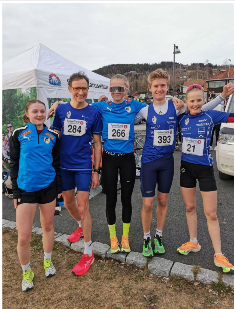
Blide LIFere etter årets Kringsjåløp 24. april